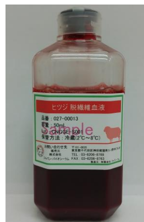
プラスチックボトル